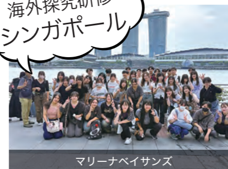
マリーナベイサンズ