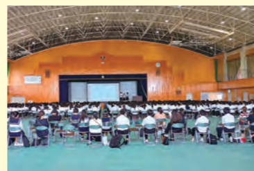
探究学習全体発表会