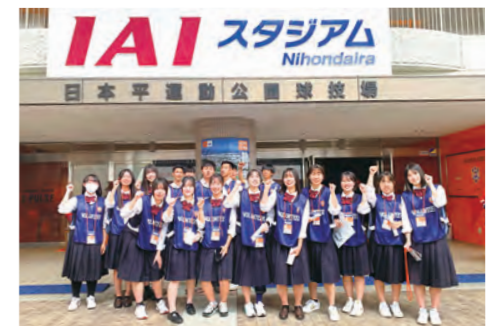
エスパルスのスタジアムボランティア参加