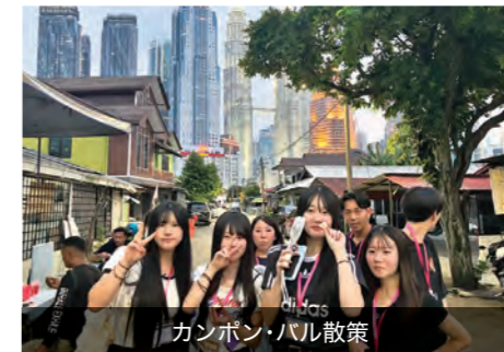
カンボン・バル散策