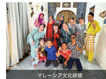
マレーシア文化研修