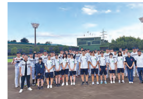
ハヤテベンチャーズ静岡の試合運営参加