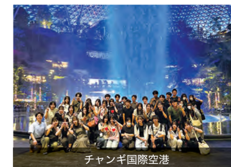
チャンギ国際空港