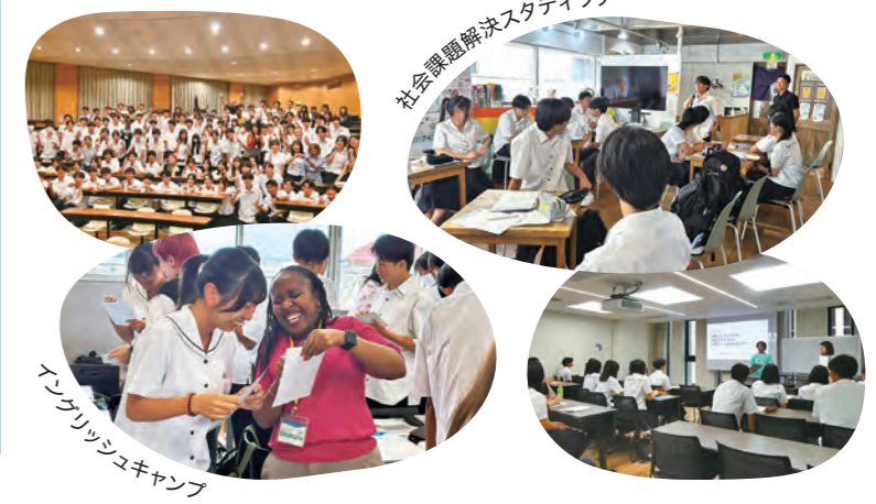
社会課題解決スタディツアー