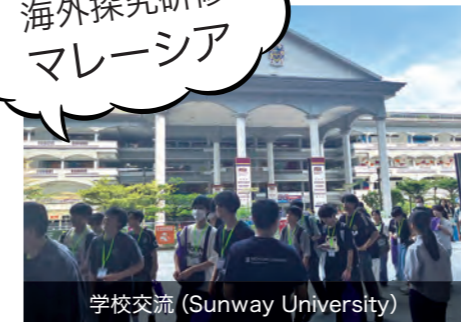
学校交流 (Sunway University)