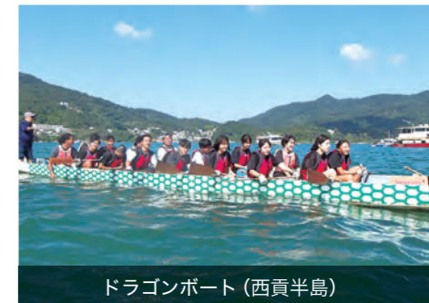
ドラゴンボート(西貢半島)